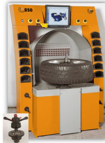
SEIB RATEC 850 BP