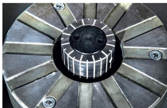
Alles aus einer Hand. Made in Germany.