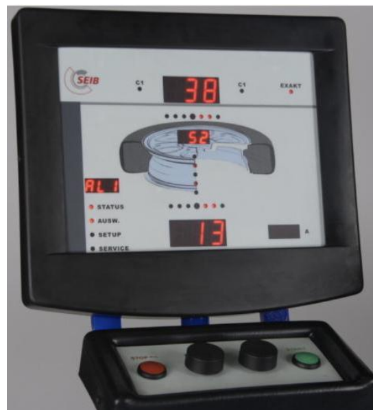
SEIB RATEC 1