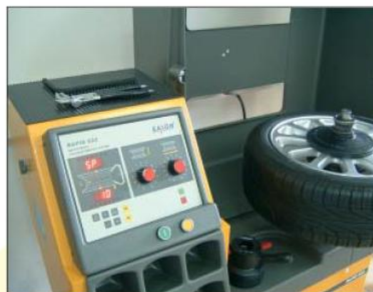
RAPID 622 FM