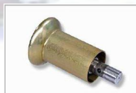
Rolna pro bezdušové pneu