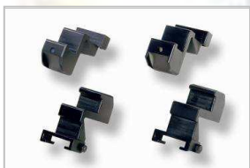
Ochranné kryty upínacích čelistí pro ALU kola