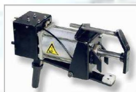
SPT 9 Pneumatický stlačovač