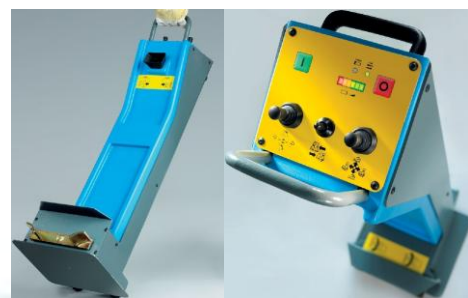
Dálkové radiové ovládání Jumbo TCS 56 R