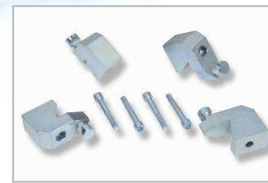
Adaptéry pro středové otvory od 80 mm

Jiří Kubů Autotechnik ASG Na Závodí 296 396 01 Humpolec