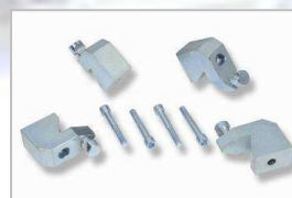
Adaptéry pro středové otvory od 80 mm