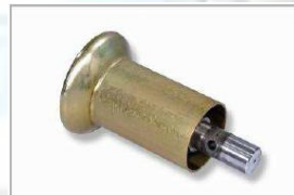
Rolna pro bezdušové pneu