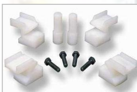
Ochranné kryty upínacích čelistí pro ALU kola Jumbo 26