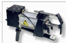
SPT 9 Pneumatický stlačovač