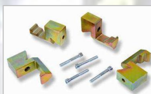
Adaptéry pro ráfky s velkou tloušťkou stěny